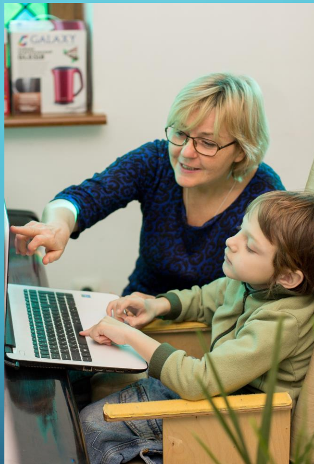
Музыкальный коррекционный педагог https://www.sozidateli.ru/profile/55043